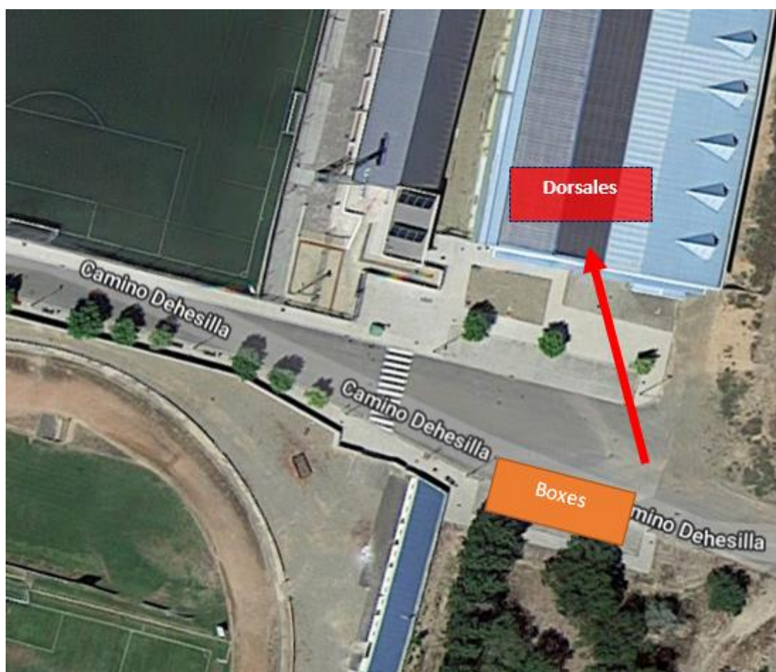
Figura 2. Plano entrega de dorsales.

También se entregarán pegatinas con el nº de dorsal para colocar en el casco y en la tija de la bici, visible en lectura horizontal.