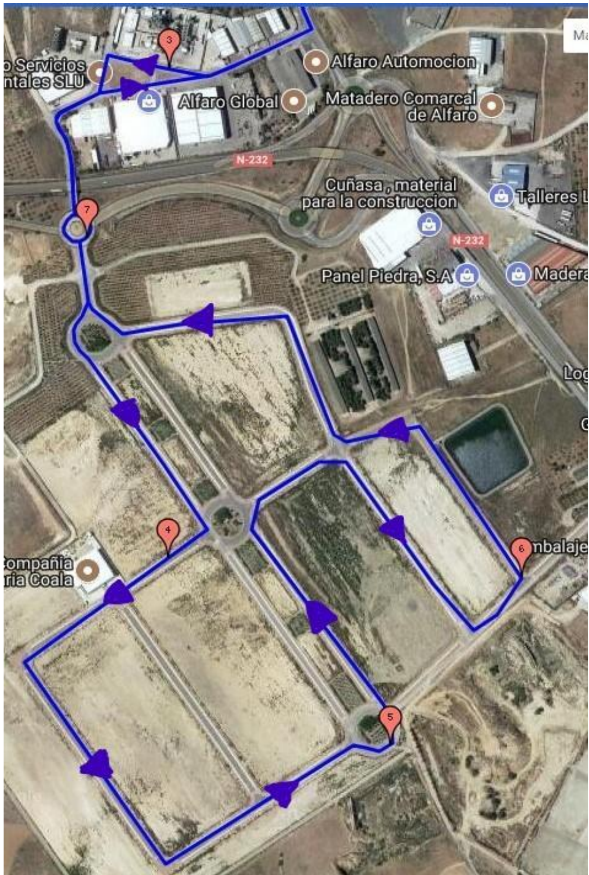
Figura 6. Segunda parte recorrido ciclista.