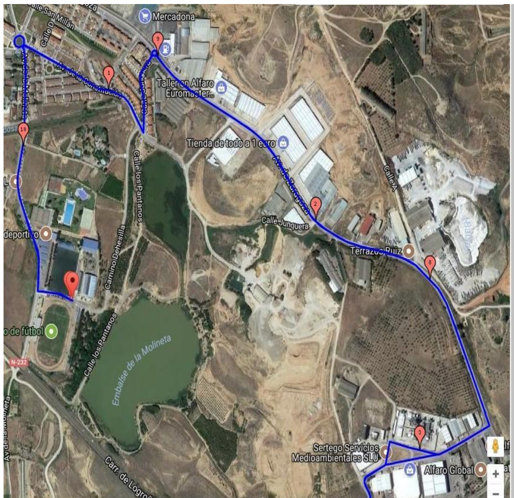
Figura 5. Primera parte recorrido ciclista.

DESCRIPCIÓN: Se saldrá desde los área de transición por la Avda. La Molineta. Al llegar a la primera rotonda giramos a la derecha por Avenida de la Constitución. Luego vamos por c/ Junquera hasta la rotonda de Mercadona. Subimos por Avda. Zaragoza hasta llegar al Bar Punto de Encuentro y giramos a la derecha por la c/ Polígono Tambarría. Desde allí seguimos hasta el POLÍGONO DE LA SENDA , donde daremos una vuelta y después recorreremos el camino inverso hasta volver a la zona de área de transición. Este circuito hay que hacerlo 2 veces.