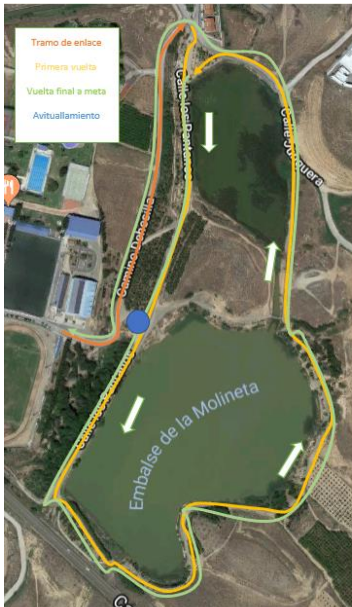
Figura 7. Recorrido carrera a pie.

Salimos desde área de transición hacia los pantanos, donde daremos 2 vueltas completas a los pantanos, y después otra vez el tramo de enlace con el área de transición y meta.