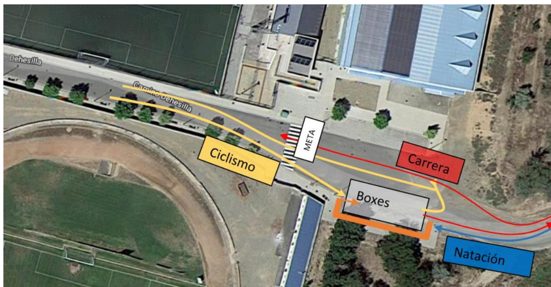
Figura 3. Entradas y salidas de área de transición y pasillo compensación.

Cada triatleta dispondrá de un sitio donde dejar el material que necesitará durante la prueba (gafas y gorro de natación, bicicleta, dorsal, casco, zapatillas de ciclismo y de atletismo, ...)