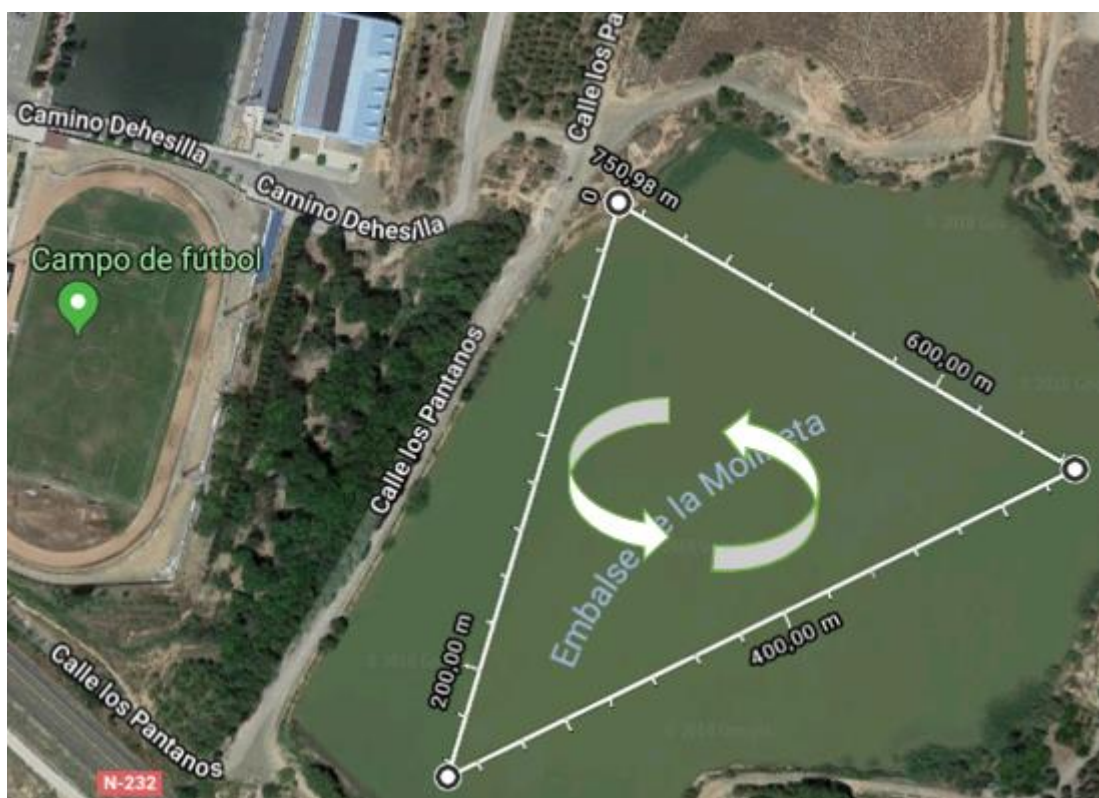
Figura 4. Plano natación y sentido de nado.

Habrán alfombras desde el pantano hasta el área de transición , para que los triatletas puedan desplazarse descalzos.